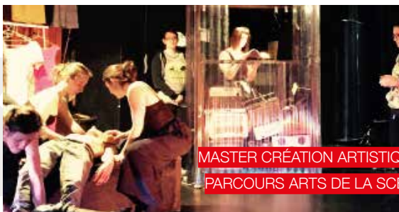
MASTER CRÉATION ARTISTIQUE, PARCOURS ARTS DE LA SCÈNE

Le master s'inscrit dans l'axe « Création, art, culture » de l'Université Grenoble Alpes, et est en relation étroite avec la SFR création, la MACI (Maison de la création et de l'innovation), l'EST (espace scénique transdisciplinaire) et Ardèche Images (documentaire de création).